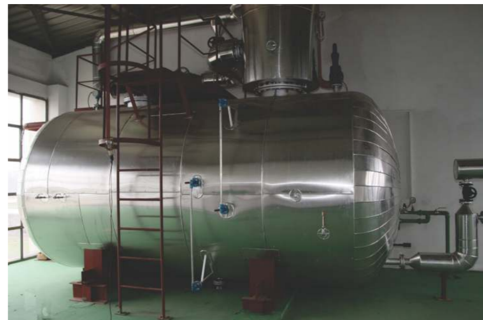
Napojni rezervoar kotla Minel

novembra, a obuhvata izbacivanje starih kotlova, izvođenje radova na adaptaciji objekta, instaliranje novih kotlova i puštanje istih u rad, što za sada teče prema definisanom planu. Novi kotlovi će biti pušteni u probni pogon krajem februara 2012. godine, a do tada će biti izvršena obuka rukovaoca. Do aprila se očekuje tehnički prijem objekta i upotrebna dozvola, što će označiti kraj ovog dela projekta.