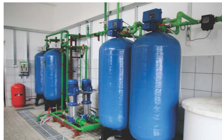
Nova oprema za pripremu vode za kotlove (dehlorinator, peščani filter, pumpe za održavanje pritiska i jonski omekšivači)